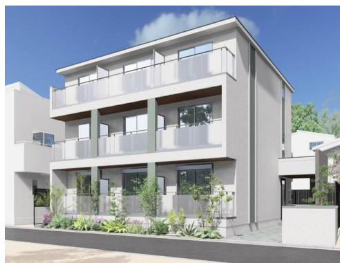
外観完成予想CGは図面を基に描き起こしたもので、外観・外構等は多少異なる場合があります。